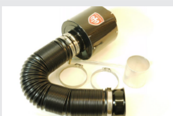
TEZZO カーボンエアインテークシステム

センターインテーク構造を採用した布フィルター式エアクリナーと遮熱性に優れたカーボンボックスで構成。エンジンに大量のフレッシュエアを送るため、出力、レスポンス、燃費向上につながります。メンテナンスが楽な乾式フィルターも特徴です。