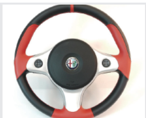
TEZZO Steering Wheel シリーズ「パレルンガ」

純正ステアリングの表皮パターンと素材を変更し、オリジナルレックスで高級感あるデザインです。純正のスイッチやエアバック類はそのまま使用可能。