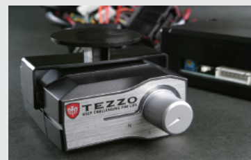
TEZZOスロットルコントローラー

出足のもっさり感を解消する、TEZZOの定番人気商品です。車種別専用設計によるオリジナルセッティング、純正カブラー形状による信頼性が人気です。リニアなアクセル操作で燃費向上にもつながります。