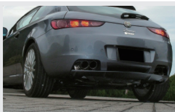
TEZZO リアディフューザー [TEZZORDBR]

整流板を大型化しリアビューをシャープに引き締め、下面のフィンで空力効果を高めています。機能美と最初からついていたような自然な仕上がりが魅力です。