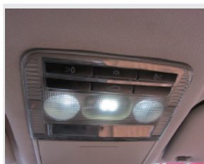
TEZZO LED ルームランプキット

・キット内容 ラゲッジルームランプ用LED マップランプ用LED(3点) カーテシランプ用LED(左右) カット済み両面テープ、 アダプターなど