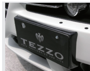
TEZZO カーボンナンバープレート台座

アルファロメオの標準ナンバープレートの薄く斜めに突き出しているのを格好よく変身させたい!という発想から生まれたカーボンナンバープレート。車種別専用設計。