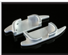
TEZZO F1タイプ アルミパドルシフト

こだわり=アルミ削り出し、シルバーのアルマイト、ショットピーニング処理の美しさ。コーナリング時の操作性の向上と撃鉄を引くような手ごたえの快感!