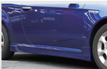
TEZZO サイドスカートエアダクト付き

ブレラ、スパイダーの逆台形フォルムを台形に補うことで、精悍なイメージに似合ったスポーティな形に変身。エアダクトが付き、流線型なラインが美しい。