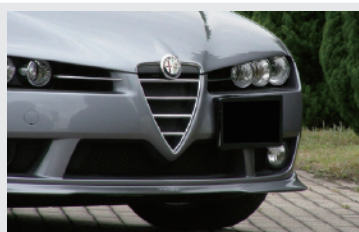
TEZZO フロントスポラー <TEZZO WEDGE LINE/TEZZO 刻印入り>

機能と美しさが融合したTEZZO ウェッジラインが特徴。ダウンフォース効果があるだけでなく、ノーマルと同程度のクリアランスが保てる工夫が施されています。