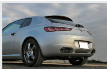
TEZZO プレミアムマフラー <スポーツ Ver.> <オリジナル Ver.> TEZZO カジュアルスポーツマフラー <スポーツ Ver.> <オリジナル Ver.>

美しいハンドメイド品。バンパー面に沿った3次面でカットし、純正バンパー穴にピッタリと収まる大径75φ4本出しのファンネル形状を採用。