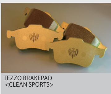
TEZZO BRAKEPAD <CLEAN SPORTS>

低ダスト仕様でホイールにこびりつくダストが減り、純正の“かっくん”ブレーキがなくなり、優れたコントロール性を発揮するブレーキパッドです。